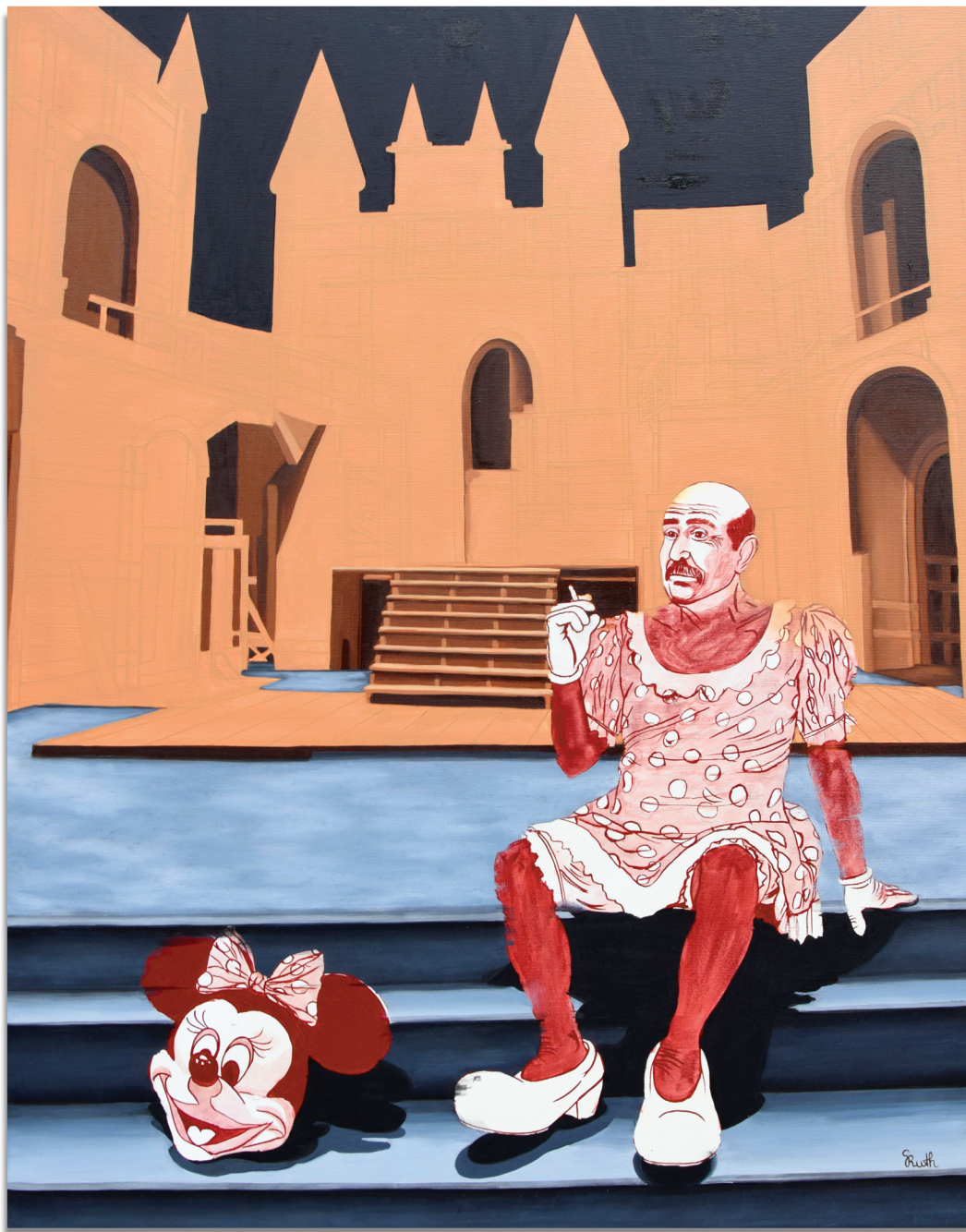
Social media 100x80 cm, olaj, akril, vászon