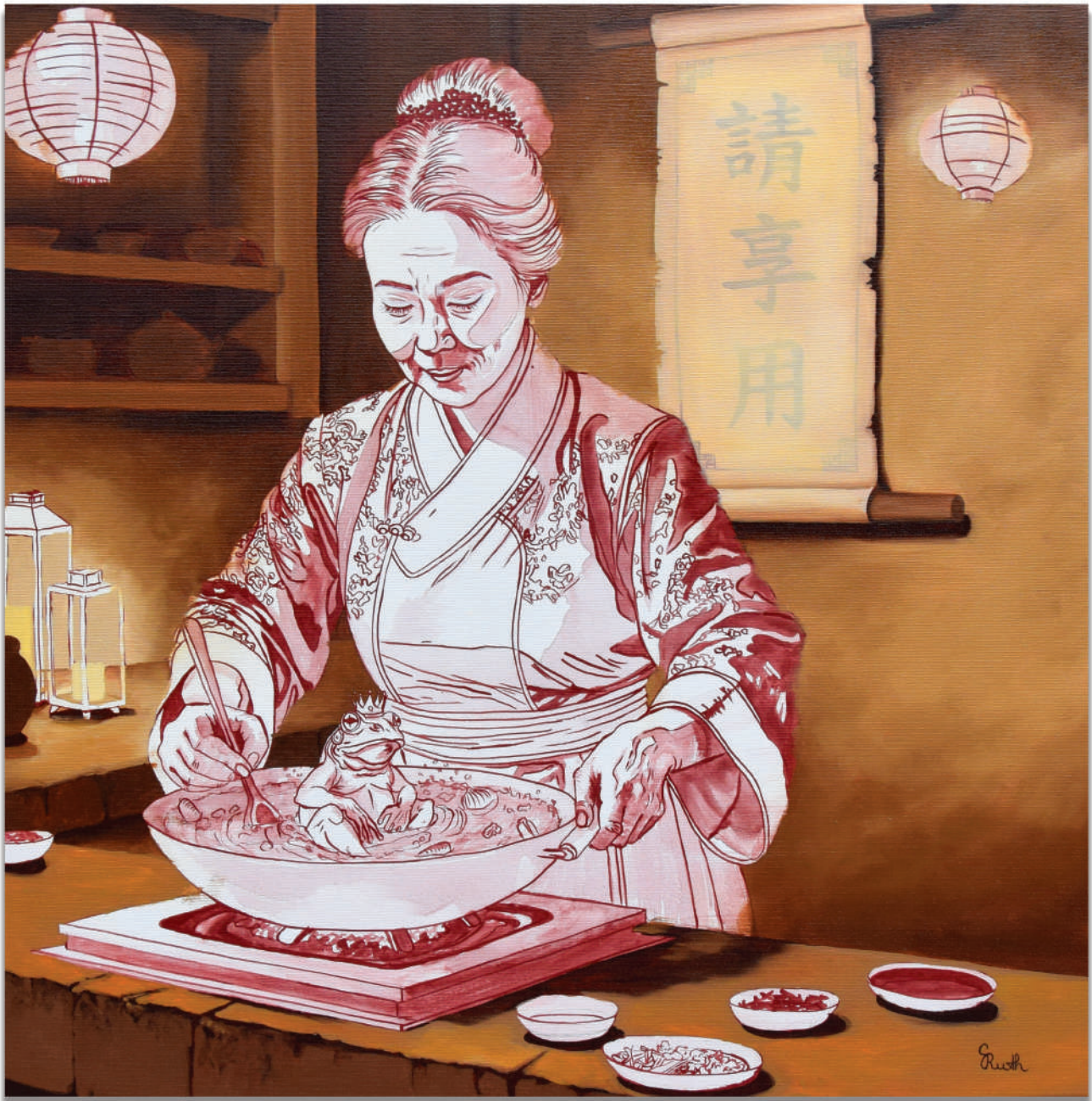
Feminismiä ? 70x70 cm, öljy kankaalle, akryyli