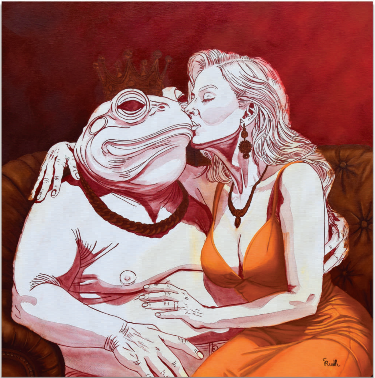
“Todellista” rakkautta 70x70 cm, öljy ja akryyli kankaalle