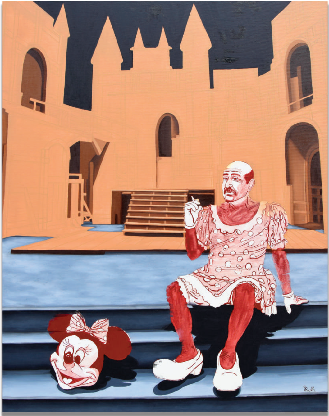
Social Media 100x80 cm, öljy kankaalle, akryyli